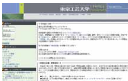
東京工芸大学工学部同窓会コミュニティサイト「t-kougei.com」

会員の住所変更や「オンライン同窓会室」に加え、携帯電話からも利用できる「ゲストBBS」、皆様のご活躍、慶弔、学内イベントなどの情報を投稿、共有できる「お知らせ」、会員のホームページを紹介できる「リンク集」、イベントなどの日程が書き込める「カレンダー」などのサービスがありますミニ同窓会や近況報告にご活用ください！