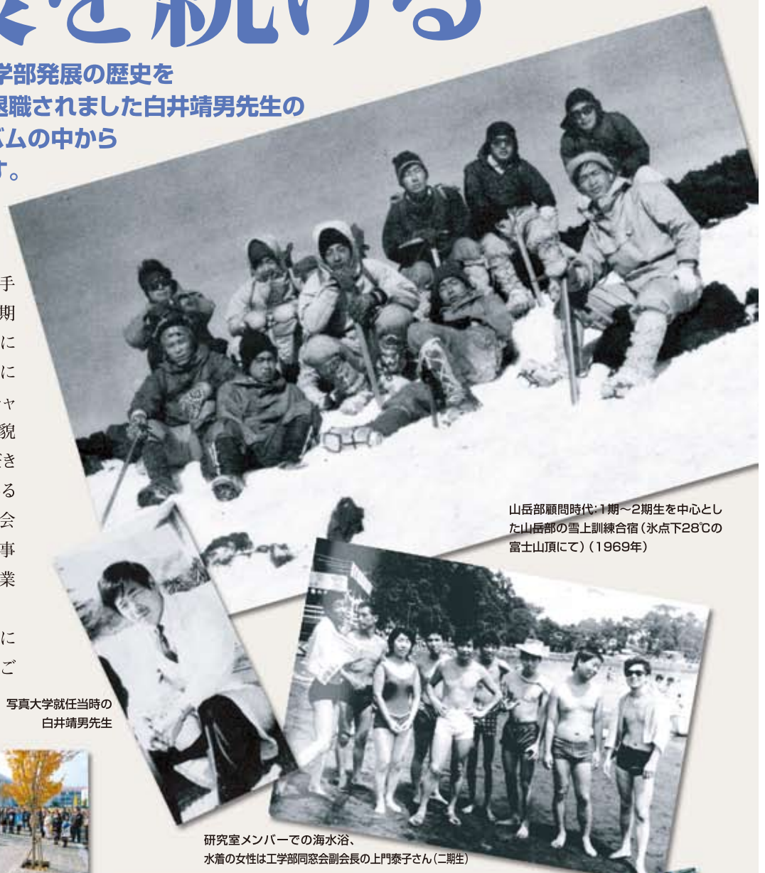
山岳顧問時代：1期～2期生を中心とした山岳部の雪上訓練合宿（氷点下28℃の富士山頂にて）（1969年）