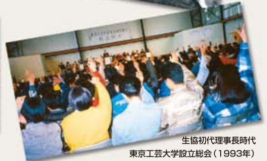
生協初代理事長時代 東京工芸大学設立総会（1993年）