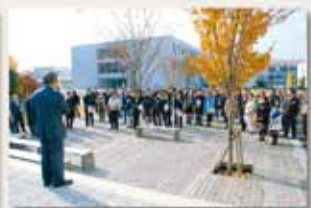
第3回目の写真・光会（2007年12月開催、 写真工学科の学科廃止に伴う記念会）