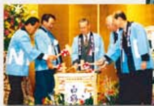
体育館建設委員会委員長時代 工学部同窓会の30周年記念事業をかねた 体育館の建設