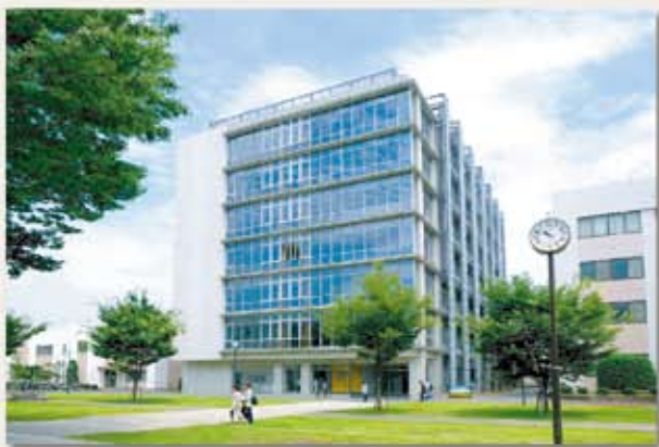
現在の工学部専用棟（10号館） 地上7階建。最新の設備を備え、旧1号館、旧2号館、旧4号館にあった研究室の大部分を集約。手前に広がる中央広場は旧2号館跡が整備され、ソーラー屋外大時計は記念樹と共に「写真・光会」の同窓生より贈られたもの。